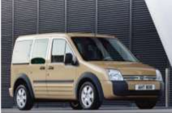
2012 FORD TRANSIT CONNECT KOMBI 1.8 TDCI