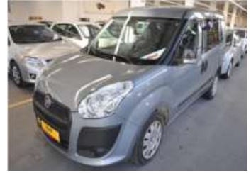
2010 FIAT DOBLO 1.3 90HP MJET EURO4 PANORAMA