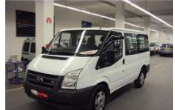
2008 FORD TRANSIT 330S 100PS KOMBI