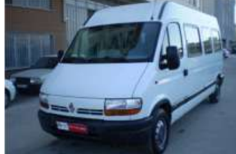
2004 RENAULT MASTER 2.5 DCI MINIBUS 14+1 DELUX