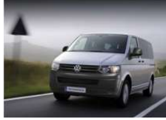
2012 VW TRANSPORTER CITYVAN 5+1 102PS LWB