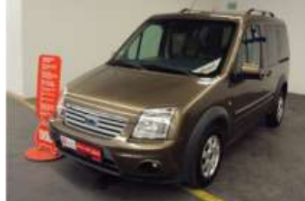
2010 FORD TRANSIT CONNECT 1.8 TDCI 110 PS K210S GLX