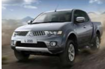
2012 MITSUBISHI L200 2.5 4x2 INVITE MT