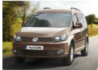
2012 VW CADDY KOMBI 1.6 TDI TRENDLINE MANUEL