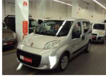
2011 FIAT FIORINO 1.3 MJET 75HP ACTIVE COMBI E4