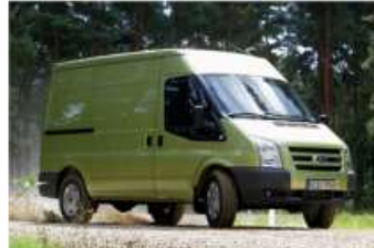
2012 FORD TRANSIT 350LF VAN 2.2 TDCI