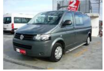
2010 VW TRANSPORTER 2.0 TDI 102 PS CITY VAN 5+1 LWB