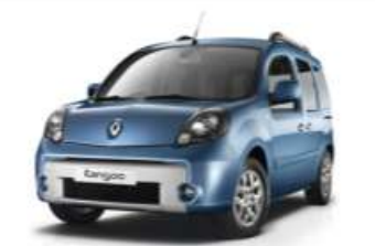
2012 RENAULT KANGOO MULTIX AUTH. EDT. 1.5 dCI 85BG