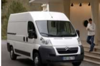
2012 CITROEN JUMPER VAN 2.2 HDI