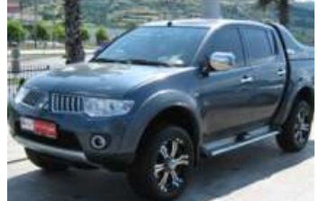
2010 MITSUBISHI L200 2.5 INVITE MD 2WD