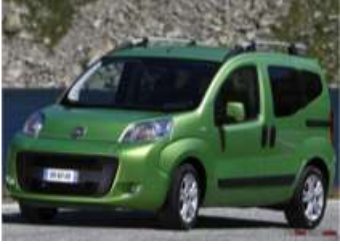
2012 FIAT FIORINO 1.3 MJET COMBI