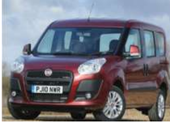
2012 FIAT YENI DOBLO COMBI 1.6 MJET