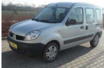
2009 RENAULT KANGOO AUTH. 1.5 DCI 65