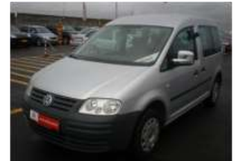
2007 VW CADDY 1.9 TDI COMBI AC CK