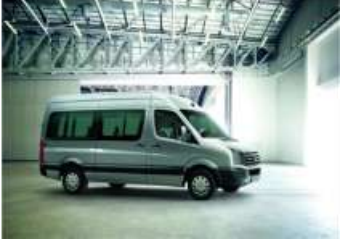
2012 VW CRAFTER 16+1 OKUL MIDLINE 163PS