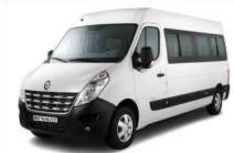
2012 RENAULT MASTER MINIBUS 13+1 COMPACT KLIMALI