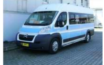
2008 CITROEN JUMPER FT35 2.2 HDI L4H2 OTOBUS 20+1