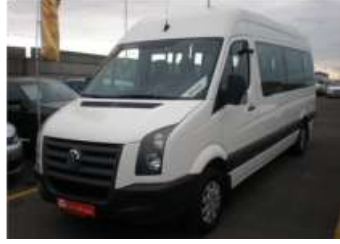
2008 VW CRAFTER 2.5TDI 109PS LWB 17+1 TREND