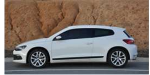
VW SCIROCCO 1.4 TSI SPORTLINE DSG

113407187 dosya numarasından inceleyebilirsiniz.